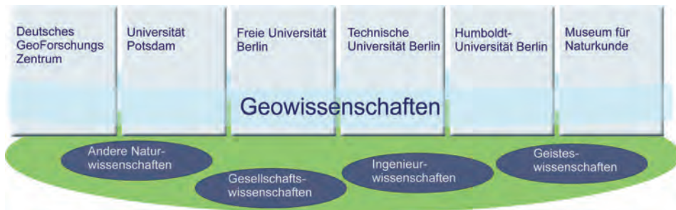
Die Partner der Geo.X-Forschungsallianz