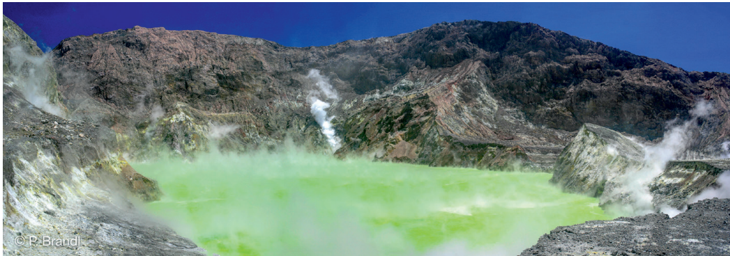
Abb. 2: Blick in den Krater von White Island, einem Inselbogenvulkan nördlich von Neuseeland. Der Kratersee des aktiven Vulkans besteht aus magmatischen Fluiden wie Wasser oder Schwefelwasserstoff, gelöstem Gestein und Regenwasser und ist extrem sauer. White Island setzt kontinuierlich große Mengen an Schwefelgasen frei. (Aufnahme: Dezember 2009)

Umgebungsdruck eine hemmende Wirkung auf die Entwicklung von Gasblasen und damit die Explosivität von Vulkanausbrüchen hat. In diesen Fällen durchbricht die Eruptionssäule häufig nicht die Wasseroberfläche, und es überwiegen Ausbrüche mit untermeerischen Lavaströmen.