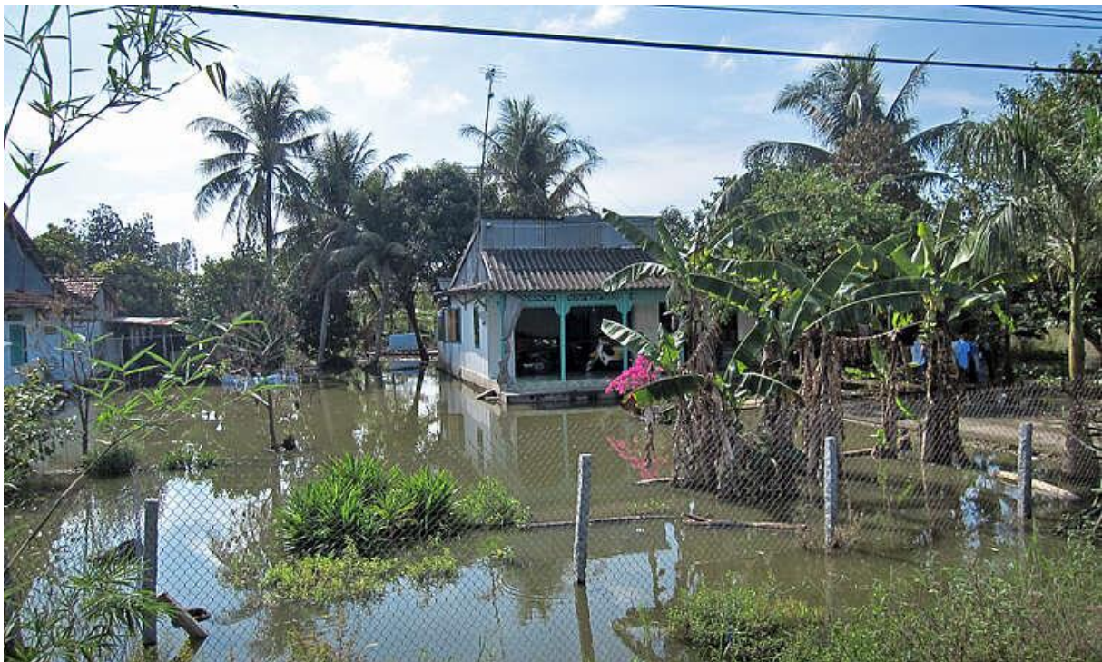
Abb. 2: Selbst eine Reduzierung des Hochwasserscheitels um 10 cm würde bei der geringen Topographie im Delta eine spürbare Verringerung der Hochwassergefährdung bewirken.

Ausmaßes auf, die einen hohen wirtschaftlichen Schaden verursachten. Öffentlichkeit und Politik prangerten daraufhin die neuen hohen Deichsysteme und die dadurch fehlenden, stromaufwärts gelegenen Überflutungsflächen an. Entsprechend kontroverse Diskussionen entstanden, insbesondere zwischen den ober- und unterstromwärts gelegenen Provinzen im Mekong-Delta. Belastbare wissenschaftliche Erkenntnisse mussten her. Wie kam es zu den hohen Wasserständen? Um diese kontroversen Diskussionen mit belegbaren quantitativen Aussagen zu den Ursachen der Überflutungen in Can Tho zu unterstützen, führten Forscher vom Deutschen GeoForschungsZentrum GFZ und dem Southern Institute of Water Resources Research in Ho Chi Minh Stadt eine Modellierungsstudie durch. In der Studie wurden mittels eines hydraulischen Modells zunächst die Überflutungen während der Hochwasser in den Jahren 2000 und 2011 nachvollzogen. Anschließend wurden die Randbedingungen der beiden Hochwasserereignisse, also die Zuflüsse ins Mekong-Delta und die Tidenpegel an den Flussmündungen von 2000 und 2011, sowie die Deichsysteme von 2000 und 2011 systematisch ausgetauscht und miteinander kombiniert. Dadurch konnte der Einfluss der drei relevanten Faktoren „Deichsystem“, „Hochwasserstärke“ und „Tidenpegel“ auf die Überflutungstiefen und -dauern in den verschiedenen Regionen des Mekong-Deltas quantifiziert werden. Das beinhaltete auch die Frage, ob und wie der Ausbau des Deichsystems die Hochwassergefährdung in Can Tho erhöht.