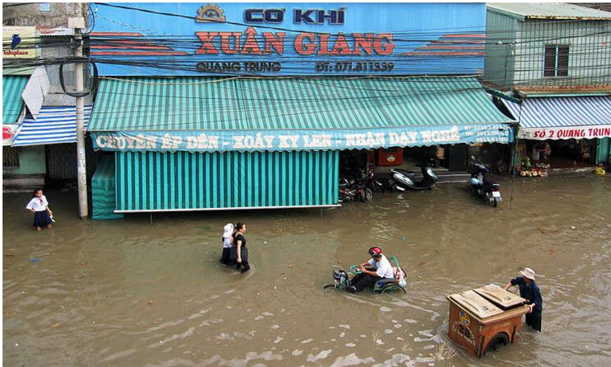
Abb. 1: Überflutete Straße in der vietnamesischen Stadt Can Tho während des Mekong-Hochwassers 2011.

Regionen entlang der Grenze zwischen Kambodscha und Vietnam. Die weiter flussabwärts gelegenen Gebiete, insbesondere die größte Stadt und das ökonomische Zentrum im vietnamesischen Teil des Deltas, Can Tho, waren jedoch nur wenig vom Hochwasser betroffen.