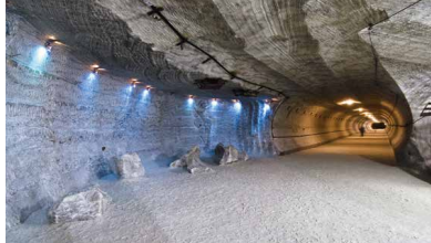
Steinsalz in einem Bergwerk