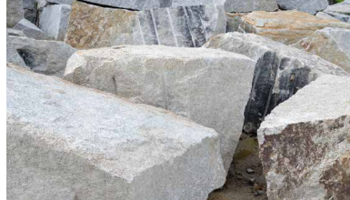
Granit in einem Steinbruch (Foto: merial-stock.adobe.com)