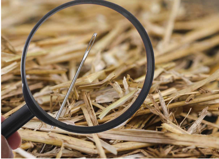
Abb. 1: Beim Standortauswahlverfahren handelt es sich buchstäblich um die Suche nach Nadeln im Heuhaufen.

Deutschen Bundestags im Mai 2017 in novellierter Fassung in Kraft trat, ist die geologische Lagerung vorgeschrieben. Der langfristige Einschluss der radioaktiven Stoffe erfolgt, von innen nach außen beschrieben, in eigens dafür konzipierten Behältern, durch die Stollenverfüllung im Untertagebauwerk, die Lagereinbauten und schlussendlich vom angrenzenden Gestein. Diese technischen und geologischen Barrieren sollen in Kombination verhindern, dass radioaktive Stoffe aus dem Endlager durch Wasser herausgelöst und über das angrenzende Gestein an die Erdoberfläche in den Lebensraum des Menschen gelangen können. Die Sicherheitsbarrieren werden als Garant gesehen, dass die Schutzziele für die Umwelt zuverlässig und langfristig eingehalten werden.