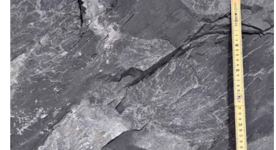
Handstück des Opalinustons