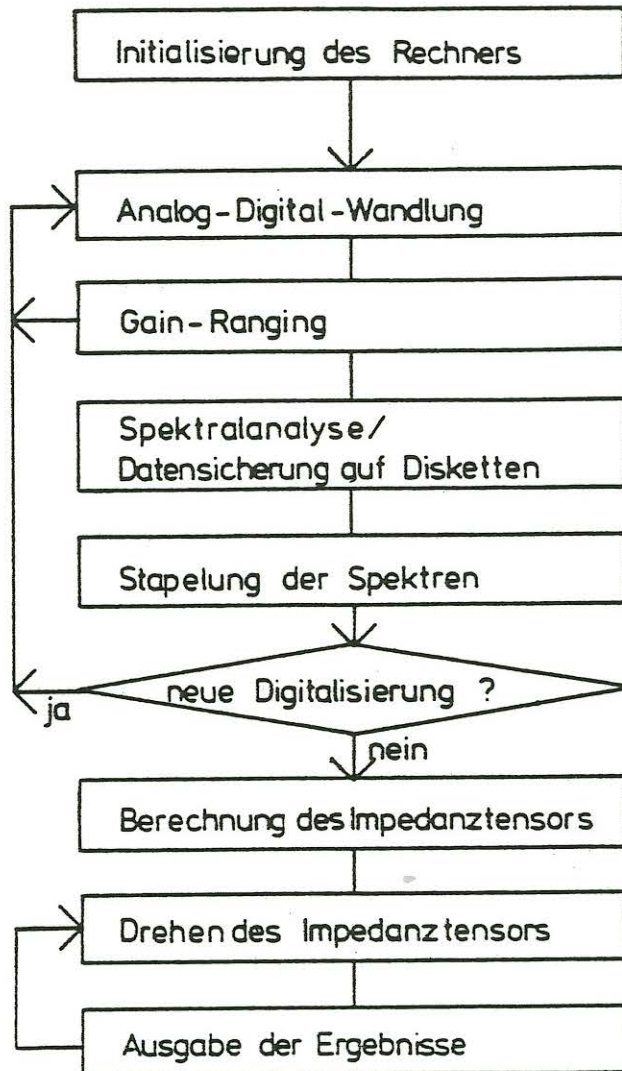
Abb. 3 Software-Diagramm