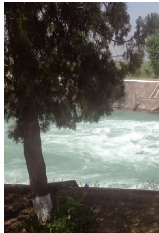
Abb. 2: Nutzung der Ressource Wasser zur Stromerzeugung: der Naryn bei Uchkurghon.

Zu sowjetischer Zeit spielte der Interessenausgleich zwischen Ober- und Unterliegern des Flusses mit ihren jeweiligen Ansprüchen keine Rolle, da die Bewirtschaftung zentral in Moskau geregelt wurde und diese Vorgaben einzuhalten